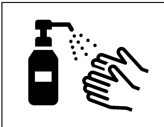
アルコール消毒のお願い

郡上八幡ホテル積翠園では、チェックイン時に宿泊されるお客様全員の消毒と検温と免許証、保険証等の身分証明書によるご本人確認をお願いしております。